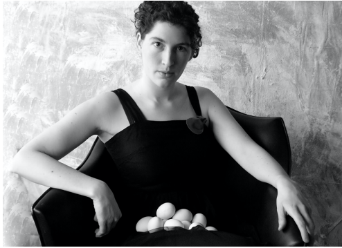
Femme portant des oeufs Photographie sur carton, 29,5 x 35,5 cm (avec cadre)