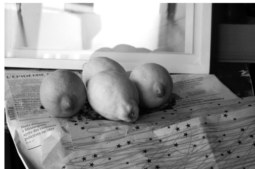
Quatre citrons Photographie sur carton, 51 x 71cm (encadrée sous verre) © W. Vynck