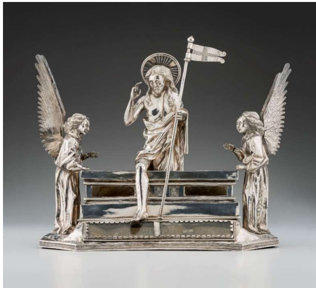
Reliquaire de la Résurrection , travail des Flandres ou du nord de la France, ca 1500, argent repoussé et ciselé, verre et pierre.

Le visiteur suit un parcours qui l'emmène entre autres à travers vers l'Ecosse, l'Italie ou la Pologne mais aussi vers le sultanat de Tunis, Alexandrie et bien sûr le Sinaï et Jérusalem. Il y découvre les dilemmes qui peuvent se poser, les conditions de voyage souvent éreintantes, l'importance cruciale du choix des compagnons de voyages. Les réponses ont certes évolué mais les questions du voyageur restent en grande partie les mêmes. Au cours de son pèlerinage en Terre Sainte en particulier, Anselm Adornes a traversé des régions de l'actuel Moyen Orient où l'insécurité politique était omniprésente. Il est hélas difficile de ne pas tirer quelques parallèles avec la situation actuelle... L'exposition nous rappelle que voyager reste une chance, parfois un danger, toujours un enrichissement personnel et un apprentissage de la tolérance.