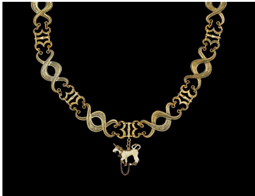
Collier de l'Ordre de la Licorne (reproduction du 20 e siècle)-eeuwse replica), verguld zilver.