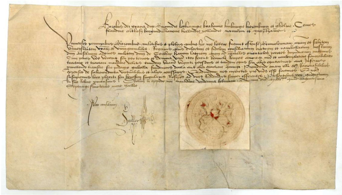
Sauf-conduit accordé par Charles le Téméraire, duc de Bourgogne, à Anselm Adornes en vue de son voyage en Perse, 1474.

Nous sommes heureux d'avoir pu bénéficier du soutien de la Loterie Nationale pour l'organisation de cette exposition.