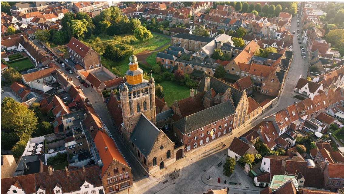
Le Domaine Adornes avec la chapelle de Jérusalem, l'hôtel particulier et les maisons-Dieu.

Le Concertgebouw de Bruges met également Anselm Adornes à l'honneur en le choisissant comme personnage central du GOLD festival 2024 qui célèbre les voix de la Renaissance, du 9 au 12 mai 2024