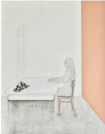
Yves Velter, The Portent, 2020 Acryl, chinese inkt, pigment, potlood, sleutels, copie van brief van Trees, glas op doek, 180 x 140 cm