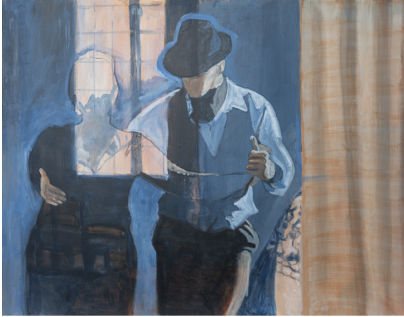
Johan Clarysse, The Big Conversation , 2021 Olie op doek, 70 cm x 90 cm © Jan Darthet