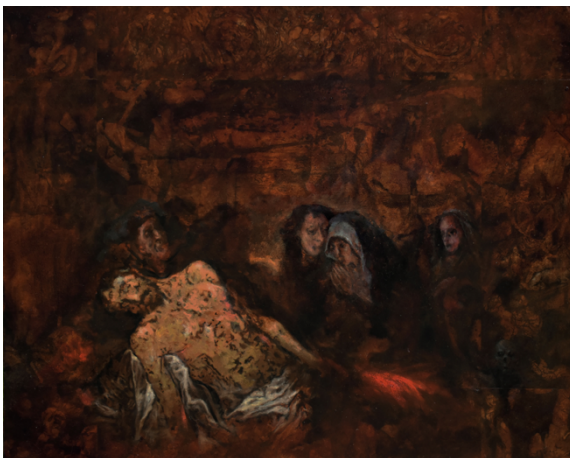
Roeland Kotsch, Fading Memories I , 2022 Olieverf op collage van etsen, 73 cm x 91 cm © Roeland Kotsch