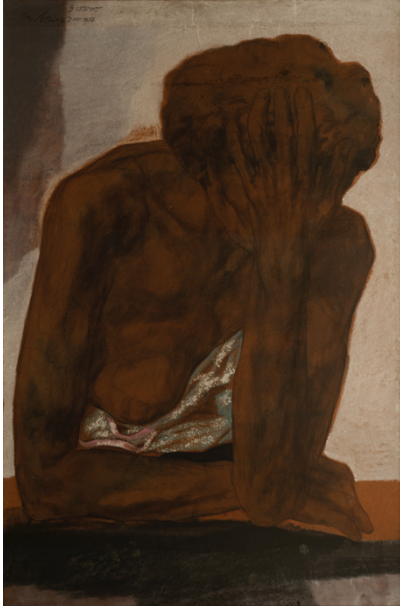
Jos Verdegem, Sorrow, 1956 Aquarel op papier, 115 cm x 76 cm, privécollectie © Danny Cools