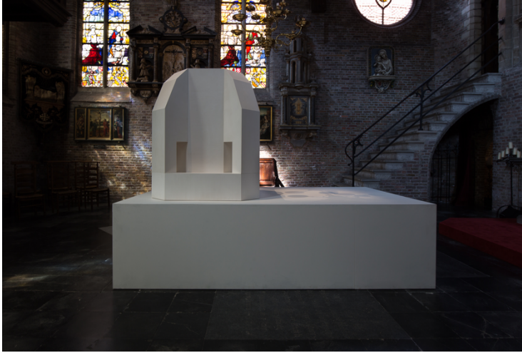
Renato Nicolodi, Assenza Presente , 2022 (in Jeruzalemkapel) Acrylhars, 105 cm x 105 cm x 126 cm, Courtesy of Axel Vervoordt Gallery © Kristina Altink