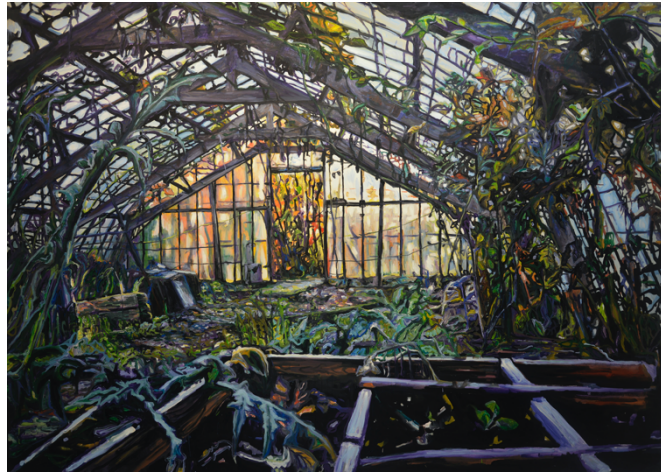
Peter Weidenbaum, After the Frost (Nature morte), 2021 Olie op doek, 200 x 280 cm