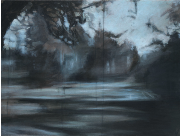
Reniere&Depla, Un monde sans échos , 2020 Acryl op doek, 70 cm x 93 cm