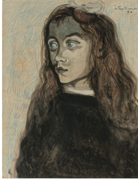
Léon Spilliaert, Vissersmeisje, 1910 Oost-indische inkt, gewassen, zwart krijt, kleurpotlood op papier 65 cm x 50 cm, privécollectie

Maar wat speelt zich dan af in die gesloten geest van de melancholie? Ieder van ons werpt wel eens een voyeuristische blik over het panorama van het verleden. Nostalgie is niemand vreemd. Maar de melancholie worstelt met het verlies van iets ultiem, iets absoluut onbereikbaar. Te midden van een verveelde wereld van alledaags divertissement, blijft die verloren schat schitteren in de vaagheid van herinneringen. In het denken persisteert het onherstelbare van het verlies. Maar is het wel een reëel verlies? Misschien is het veeleer een imaginaire poging om iets wat onvervuld is voor zichzelf te doen voorkomen alsof het verloren is. Zo begrijpen de filosofen Giorgio Agamben en Slavoj Žižek het althans. In herinnering de woorden van Sigmund Freud in zijn beroemd essay Trauer und Melancholie : '(...) maar men kan er niet goed achterkomen wat werd verloren'. Er is een onbestemd verlangen dat zwalpend naar een invulling zoekt. Het is iets wat maar moeizaam tot het spreken toegang vindt. Paradoxaal genoeg getuigt literatuur graag op spraakzame wijze over dit onuitsprekelijk verlies.