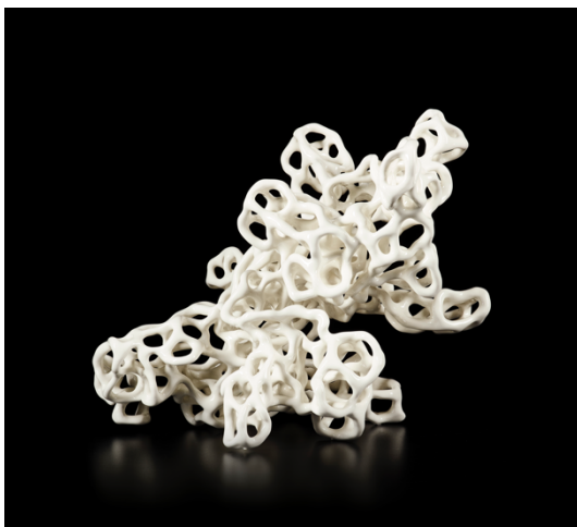
Nick Ervinck, TIEWCERNIL, 2016 Ceramic, 27 x 33 x 33 cm © Nick Ervinck