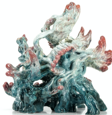
Nick Ervinck, BRUNTUSLA, 2018 Ceramic, 29 x 31 x 31 cm © Nick Ervinck