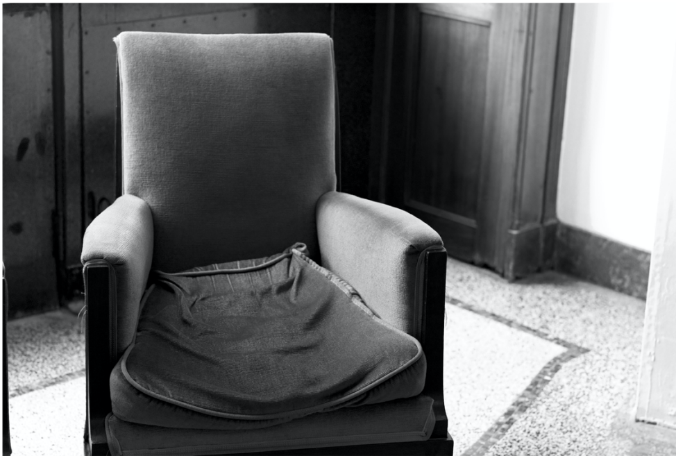
W. VYNCK, Zetel - 37,3 x 45,8 cm (met multiplexen lader) - © Willy Vynck

Brugge, Adornesdomein, van 16/10/2021 tot 22/01/2022 : In het goed bewaarde middeleeuwse decor van het Adornesdomein en de Jeruzalemkapel, brengt de fotograaf Willy Vynck een ode aan de schoonheid van het dagelijkse leven.