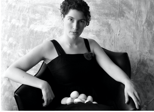
Mevrouw draagt eieren

Fotografie op karton, 29,5 x 35,5cm met kader © W. Vynck