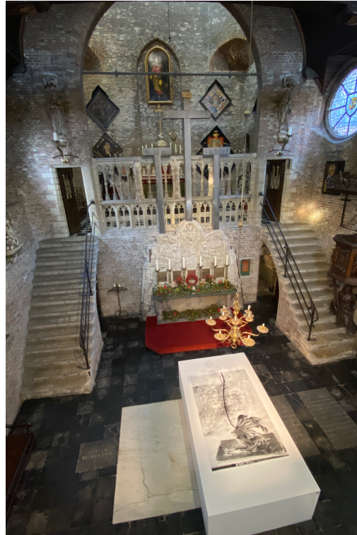
Memento Mori in situ Jeruzalemkapel, Brugge