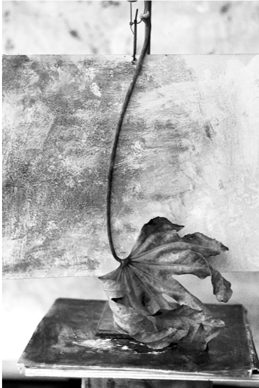
Memento Mori Fotografie op Japans papier, 120 cm x 170 cm © W. Vynck

Niet toevallig vervangt zijn werk het praalgraf dat normaal gezien bovenop de grafkelder van Anselm Adornes en zijn vrouw, Margareta van der Banck staat. Een stervend blad houdt zich wanhopig vast aan iets bovenaan, alsof het een baxter is. Het feit dat Vynck zijn werk hier kan neerplaatsen, is om dezelfde reden: om de schoonheid te bewaren van het monument, wordt deze momenteel gerestaureerd. Het praalgraf is zo ook belangrijker geworden dan de beenderen die zich in de grafkelder eronder bevinden.